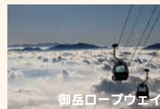
御岳ロープウェイ