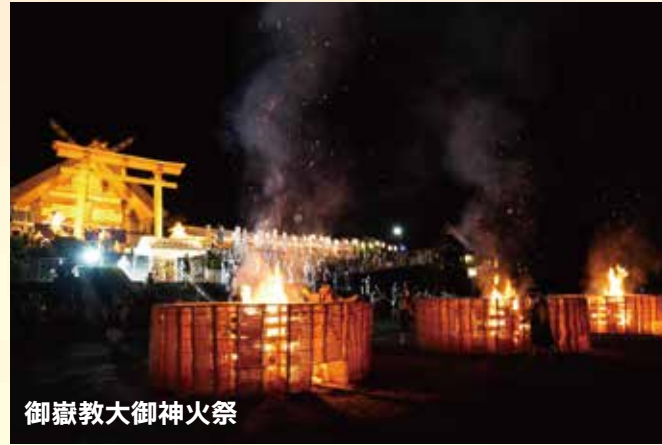
御嶽教大御神火祭

みこしを担ぎ「惣助! 幸助」という掛け声と共に、町中を練り歩き、23日の夜にそのみこしを落とし、まくって(転がして)最後には壊してしまうという豪快なお祭り。「天下の奇祭」としても知られています。22日の夜には、花火大会もあります。(毎年 7月22日・23日予定)